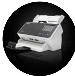
Alaris S2060w/S2080w Scanner