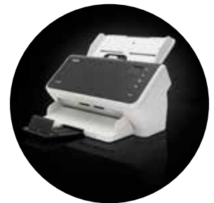
Alaris S2050/S2070 Scanner